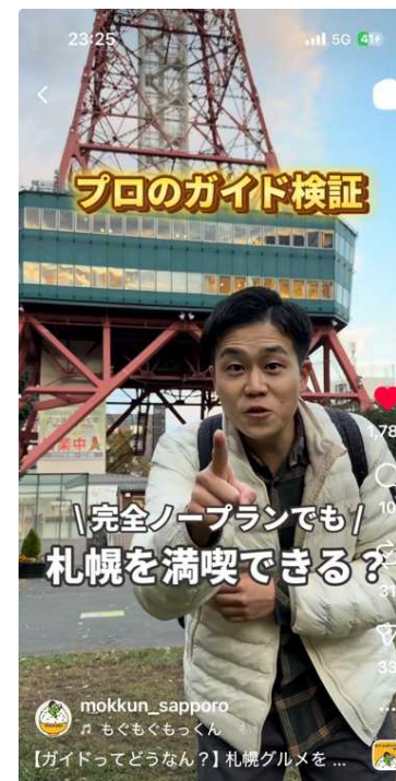
▲もっくん氏Instagramアカウント (フォロワー約14万人)での発信