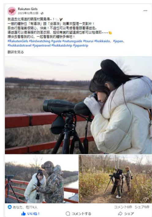
▲Rakuten Girls Facebookアカウント (フォロワー約23万人)での発信