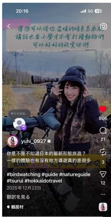
▲筠熹氏Instagramアカウント (フォロワー約33万人)での発信