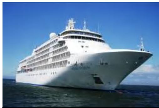
「シルバー・シャドー」(28,000ト)

釧路港へ初入港となるシルバーシークルーズの「シルバー・シャドー」が、5月18日朝、発達した低気圧の影響で1時間ほど遅れ中央埠頭に着岸した。