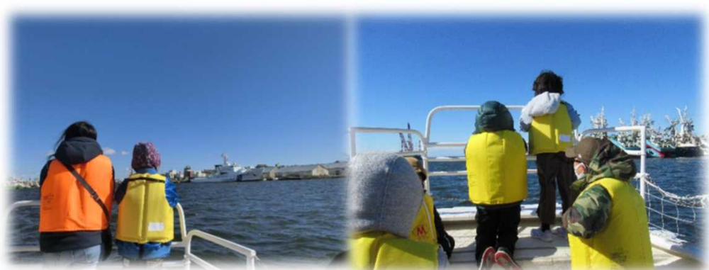
甲板上から釧路港を見学