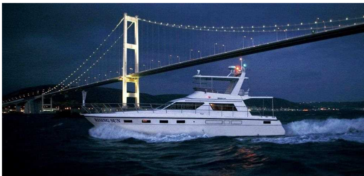
使用船舶「スターマリン(株)／ライジング サン」

【本件に関する問い合わせ】※取材を希望される方は事前にご連絡をお願いいたします。