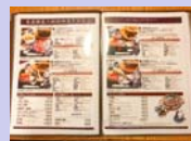
メニューの多言語化 (ホームページ含む)