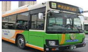
路線バス事業者(定期運行)