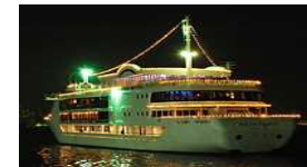
旅客不定期航路事業者 (遊覧船等)