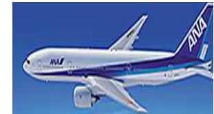
本邦航空運送事業者