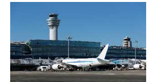
航空旅客ターミナル管理者