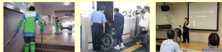
高齢者疑似体験 車椅子サポート体験 当事者講師によるセミナー