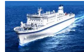
一般旅客定期航路事業者