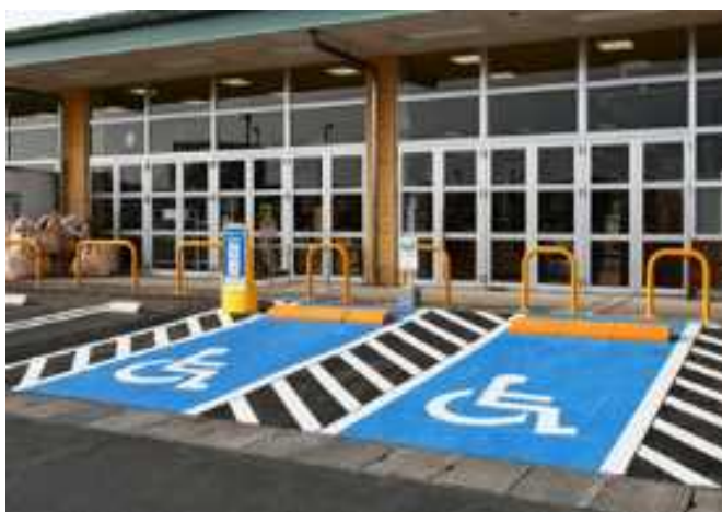
(車椅子使用者用駐車施設)