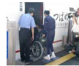
車椅子サポート体験