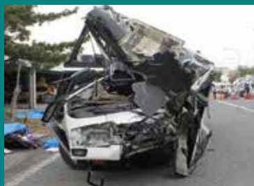
関越道高速 ツアーバス事故

重大な事故を起こした貸切バス会社はいずれも下限額を下回る運賃で運行を行っていました。