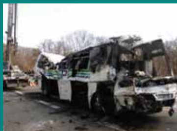
軽井沢 スキーバス事故