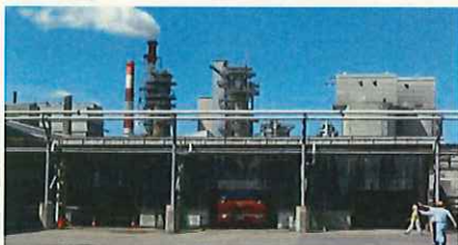
荷役ホーム(左側に増設)