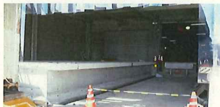
荷役ホーム拡張部分(工事中)