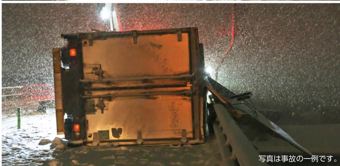
写真は事故の一例です。