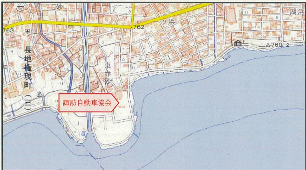
「国土地理院地図(電子国土 Web)」の一部に書き込み