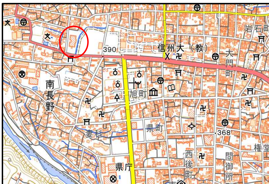
電子地形図（国土地理院）を加工して作成

※ 乗用車以外 での来場は出来ません。駐車場でのトラブル等には一切の責任を負いかねますので、あらかじめご了承ください。