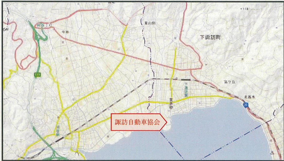
「国土地理院地図(電子国土 Web)」の一部に書き込み