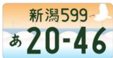
図柄入りナンバー「新潟」

令和4年9月には、2025年日本国際博覧会(大阪・関西万博)の開催を記念した特別仕様ナンバープレートを、期間限定で全国の希望者へ交付することが発表されました。デザインは大阪・関西万博の開催機運の醸成をコンセプトに公式ロゴマークのフォルムをモチーフにしており、令和4年10月から令和7年12月までの約3年間の期間限定で交付することになっております。