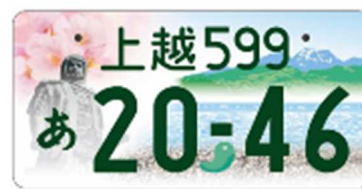
図柄入りナンバー「上越」