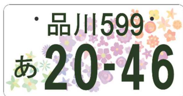
全国版図柄入りナンバー