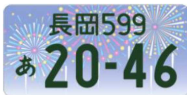
図柄入りナンバー「長岡」