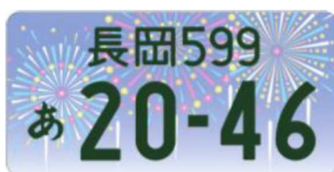
図柄入りナンバー「長岡」