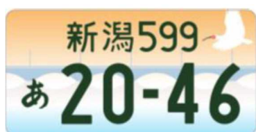
図柄入りナンバー「新潟」

令和7年7月14日から令和9年11月末までの期間限定で交付することになっております。