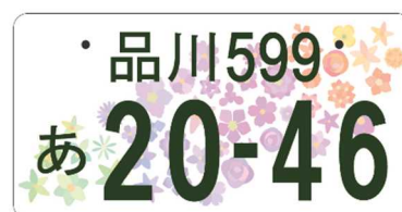
全国版図柄入りナンバー