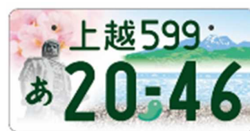
図柄入りナンバー「上越」