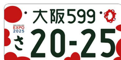
大阪・関西万博特別仕様ナンバー