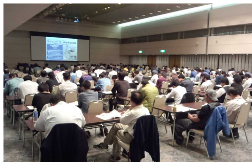
整備管理者選任後研修

整備管理者に新たに選任されようとする者に対しては「整備管理者選任前研修」を、既に選任されている者に対しては「整備管理者選任後研修」を実施し、整備管理の確実な実施とスキルアップ、コンプライアンスの徹底に努めていただくよう研修を計画し開催しています。