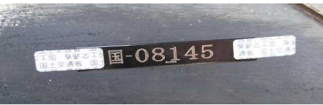
職権打刻プレートによる表示方法

なお、増加した打刻件数に対応するために平成21年7月からは、主に職権打刻プレートを貼付する方法で職権打刻を実施しています。