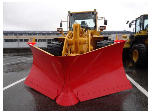
除雪をするために認定を受けた基準緩和車両