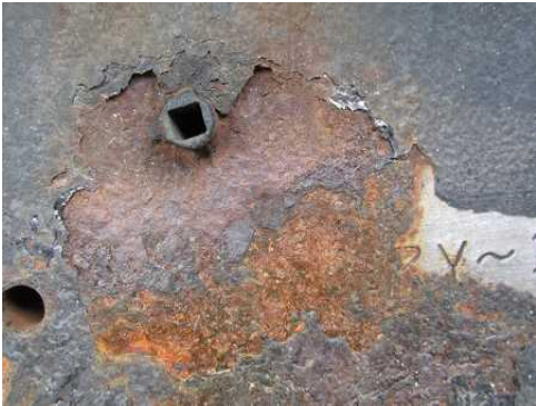
腐食し識別困難となった車台番号

特に、冬期の道路に散布された融雪剤の付着により、車台番号や原動機型式の打刻部分が腐食することが多く、これらの識別が困難になる自動車が増加しております。