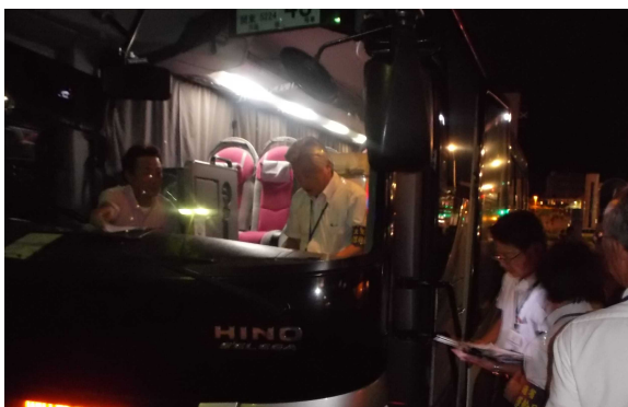
安全運行一斉点検

平成28年1月15日未明、長野県軽井沢町の国道18号線碓氷バイパス入山峠付近において、乗員乗客41人を乗せた貸切バスが、対向車線を越えて道路右側に転落し、乗客13名、乗員2名の計15名が死亡、乗客26名が重軽傷を負うという重大事故が発生しました。