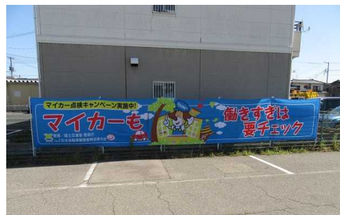
各種運動の周知活動