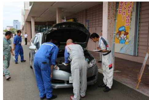
「自動車ふれあい相談所」の実施風景