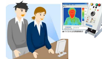
熱感知カメラ設置による感染者の公共交通利用自粛励行