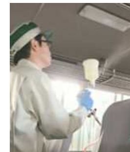
車内の抗菌・抗ウイルス対策