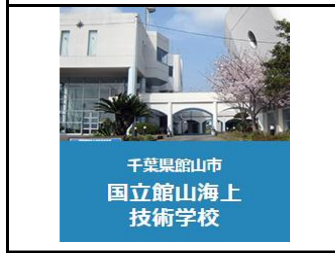
千葉県館山市 国立館山海上 技術学校

https://www.imets.ac.jp/tateyama/index.html