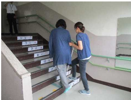
<視覚障害者疑似体験>