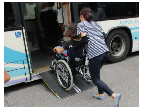
<バスの車いす体験・介助体験>