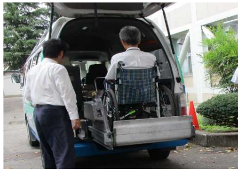
<タクシーの車いす体験・介助体験>