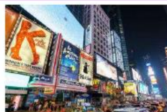
ブロードウェイ (ニューヨーク)