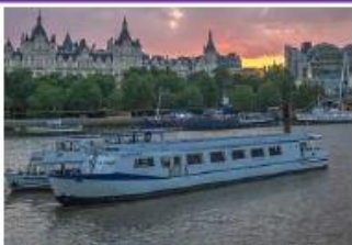
Thames Dinner Cruise (ロンドン)