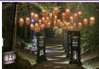
Foresta Lumina (モントリオール) 出所：ケベック州政府観光局