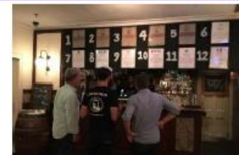
The Rocks Pub Tour (シドニー)