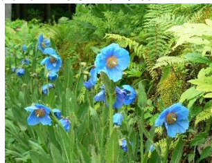
ヒマラヤの青いケシ

小学生・中学生・80歳以上の方向け乗り降り自由の割引乗車券 販売場所: 野岩鉄道有人駅、野岩鉄道の車掌 東武日光駅及び鬼怒川温泉駅ツーリストセンター 販売期間: 8月31日迄 販売価格: 野岩鉄道ホームページよりご確認ください。 ※上三依水生植物園では、夏休み期間中の小中学生、80歳以上の方は入園無料です。