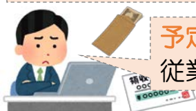
賃金の支払に困る事業主のAさん