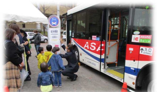
バスの乗り方教室