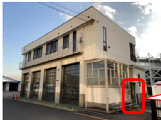
職権打刻上屋 外観