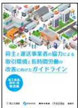
加工食品、飲料・酒物流編