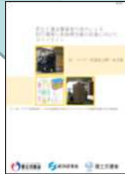
紙・パルプ(家庭紙分野)物流編

★取引環境と長時間労働の改善のため、荷主と運送事業者の協力は、中央及び47都道府県での「トラック輸送における取引環境・労働時間改善協議会」を中心に、輸送品目別実証事業によって加速させてきた。