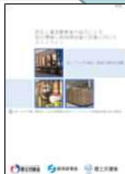
紙・パルプ(洋紙・板紙分野)物流編