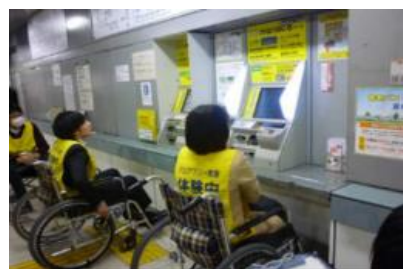
【教育啓発特定事業のイメージ】 公共交通の利用疑似体験