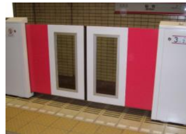
【公共交通特定事業のイメージ】 ホームドアの導入