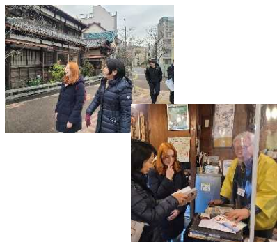
千住宿まち歩きの様子