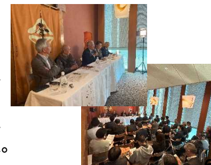
体験セミナーの様子