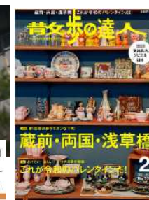
各訴求媒体の制作