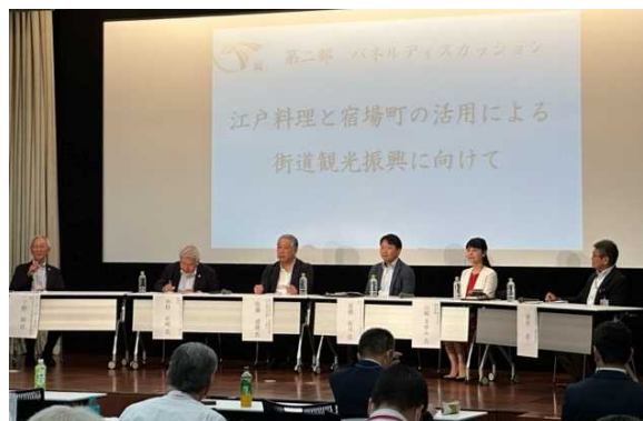
<パネルディスカッション>