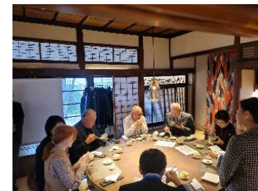
お披露目会の様子