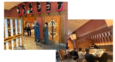
江戸料理体験&アンケート