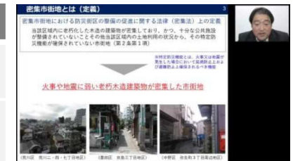
①密集市街地整備事業総論 （オンライン形式）