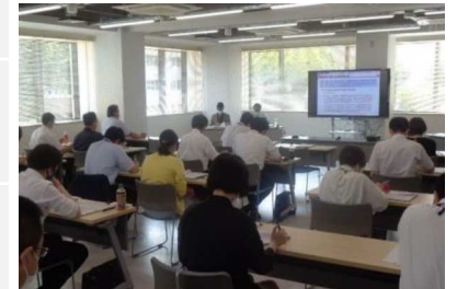
⑤住家の被害認定業務 マネジメント研修