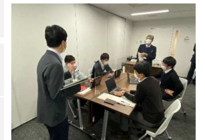
⑧復興まちづくり事業 ケースメソッド演習

【参考】令和4年度の研修実施県・・・埼玉県、神奈川県、長野県、愛知県、三重県、大阪府、山口県、大分県、宮崎県