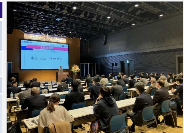
セミナー会場の様子