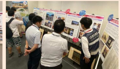
特別企画展の様子