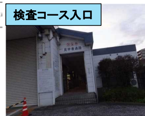
検査コース入口から入り、 右手に会議室があります。