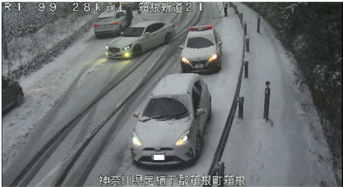
過去の車両滞留の状況 (令和6年2月25日国道1号箱根新道)