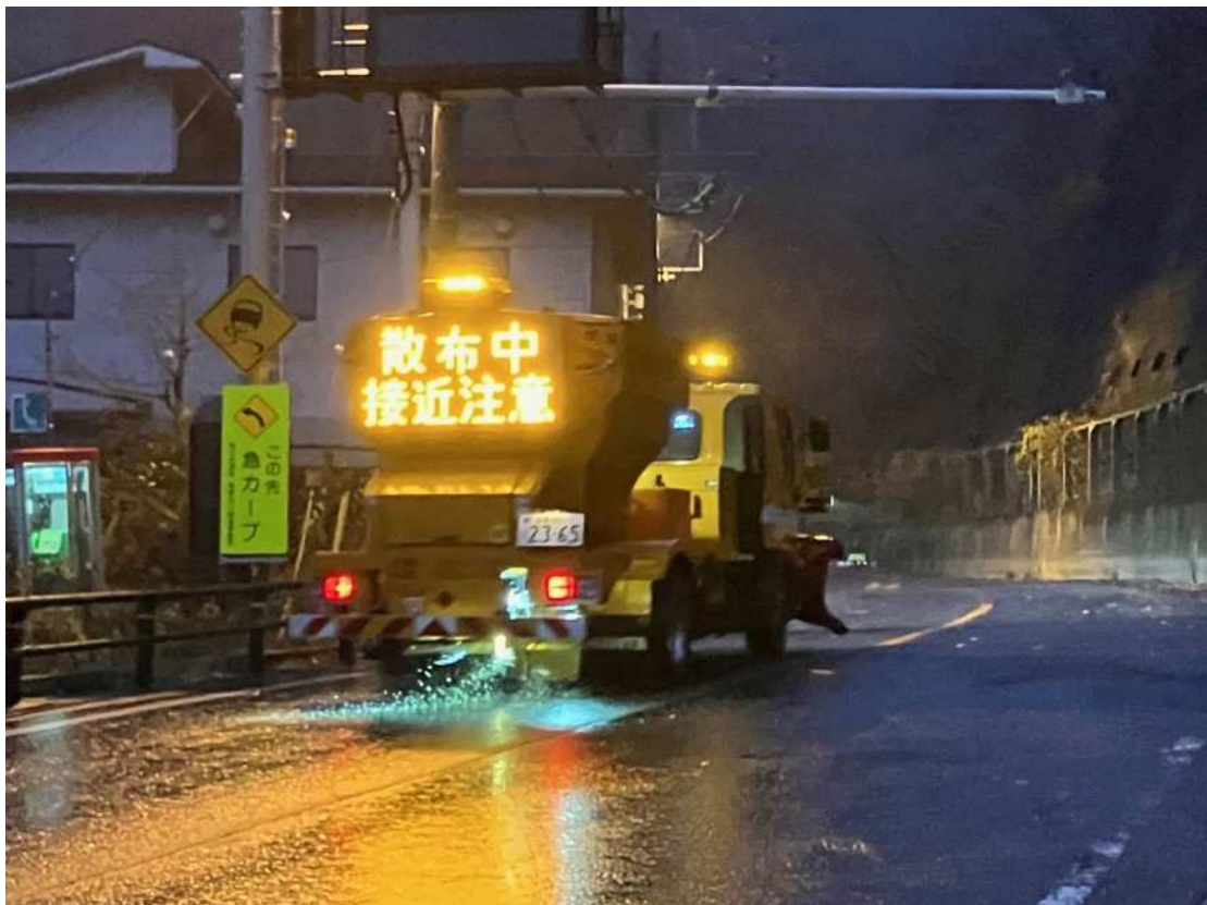
国道17号三国峠 凍結防止剤散布状況 (令和6年11月7日)