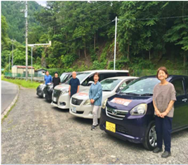
電話受付を行う5人のシニアスタッフと自家用車