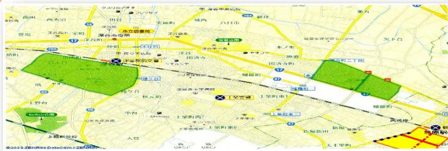
【ゾーン30区域の可視化資料】