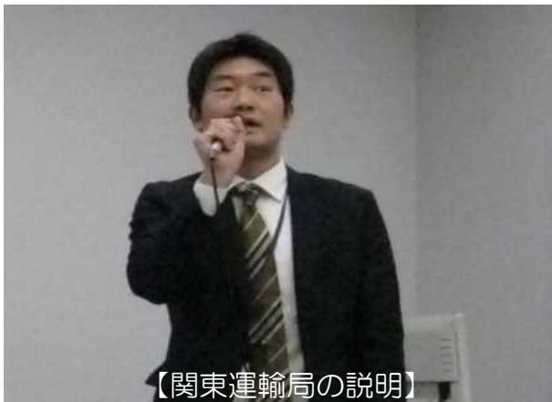
【関東運輸局の説明】