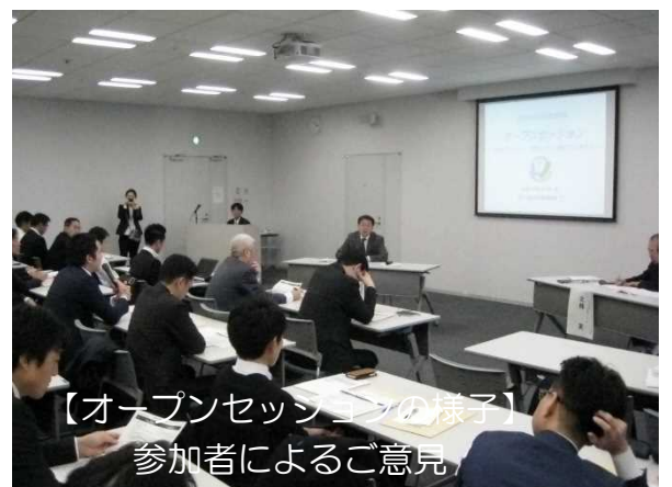
【オープニングの様子】 参加者によるご意見