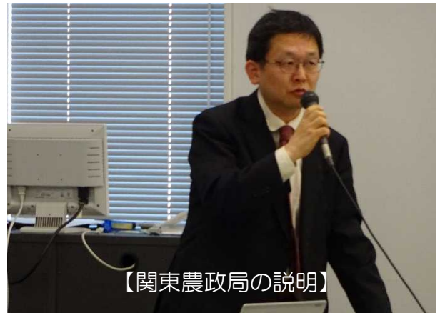
【関東農政局の説明】