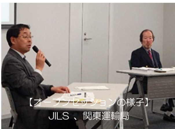
【オープニングの様子】 JILS、関東運輸局