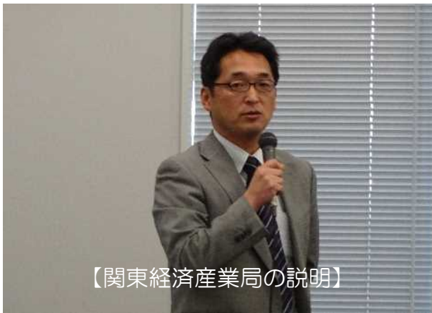
【関東経済産業局の説明】