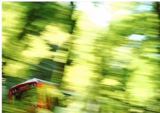
「輝く木々」 田辺 肇 (箱根登山鉄道 宮ノ下～小涌谷)