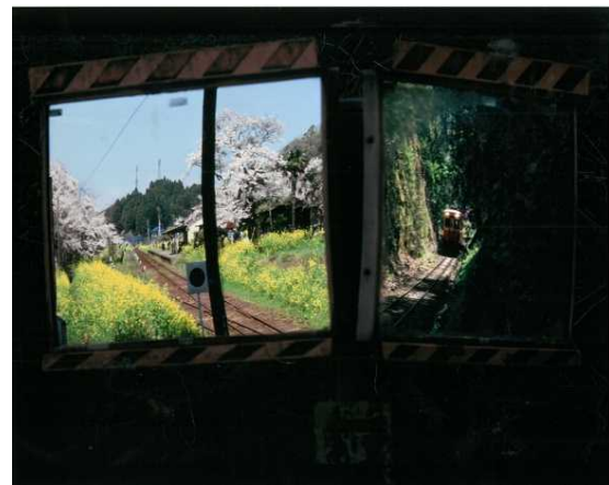
「右と左」 當麻 哲弥 (小湊鐵道 月崎駅)