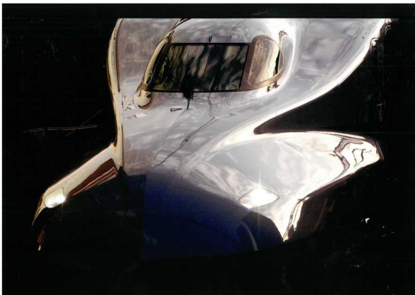
「仮面」 高橋 康資 (東京駅新幹線ホーム)