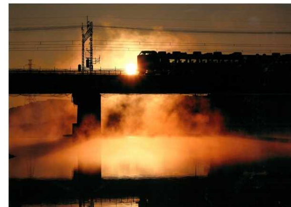
「寒さの中を・・・」 中島 真秀 (多摩川橋梁)