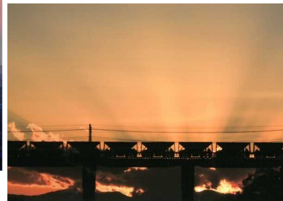
「シルエット」 山本 喜久夫 (秩父鉄道 親鼻～上長瀬)