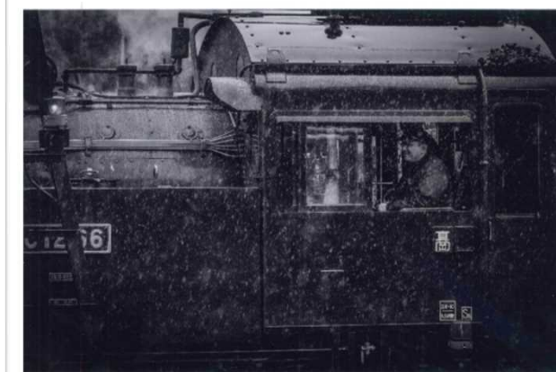
「嵐の中の『SLもおか』号」 柴平 達弥 (真岡鐵道)