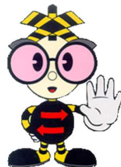
踏切事故防止キャンペーン マスコットキャラクター (愛称:ストッピー)