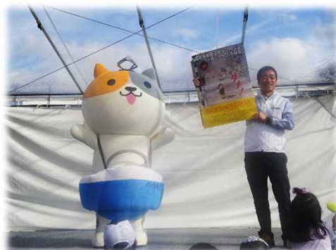
鉄道の日イベントでのPR活動