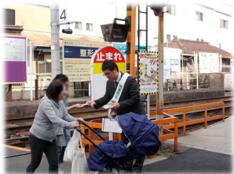
踏切道通行者への啓発活動

踏切道を通行する自動車のドライバー及び歩行者を対象に、交通ルールの遵守、安全意識を高めることを目的とした「踏切事故防止キャンペーン」を近畿地区の行政機関、警察、鉄道事業者及び自動車関係団体等が協力し実施します。