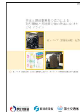
紙・パルプ(家庭紙分野)物流編