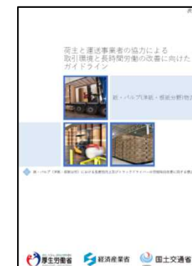
紙・パルプ(洋紙・板紙分野)物流編