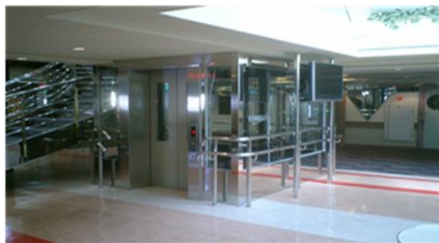
あざれあ船内エレベーター