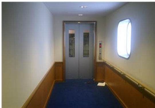
新設エレベーター及び通路手摺