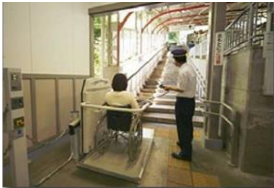
階段昇降機(極楽橋駅)