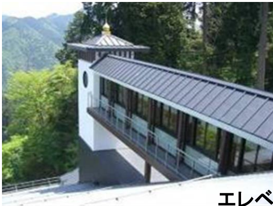
エレベーター棟(高野山駅)

南海電気鉄道株式会社は、傾斜地を走るケーブルカーの特性から構造的、技術的に困難なバリアフリー化に取り組み、施設配置や設備の検討を重ね、西日本で初となるケーブルカー駅へのエレベーターの設置やエレベーターへの複数のアクセス経路の設定、車両停車位置の移動に対応可能な階段昇降機の設置等を行った。