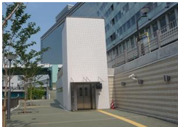
京阪天満橋駅のエレベーター (河川公園階)