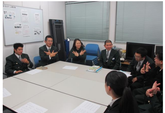
手話サークル活動