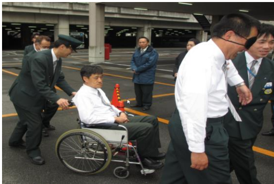
サービス介助士訓練風景

また、聴覚障がいのお客様とのコミュニケーションを補助する機器「コミュン」等を設置するなど、ハード面の整備にも取り組んでいます。