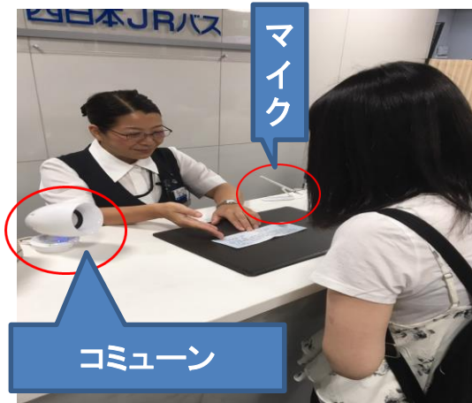
コミュン(難聴のお客様との会話を補助するコミュニケーション支援器)