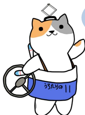
公共交通利用促進キャラクター のりたろう