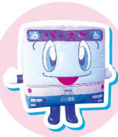
阪急バス パースケ