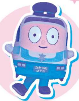
高槻市交通部 たかつき ばすお

※都合により登場するキャラクターは変更になる場合がございます。※写真はイメージです。