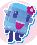
京都市交通局 京ちゃん