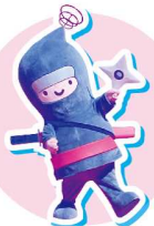
PiTaPaシンボル キャラクター びたまる