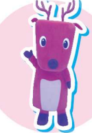
奈良交通 シーカくん