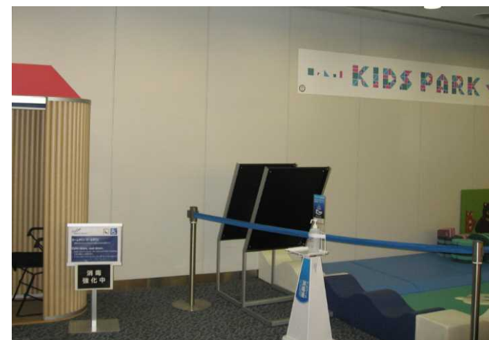
キッズスペースに隣接