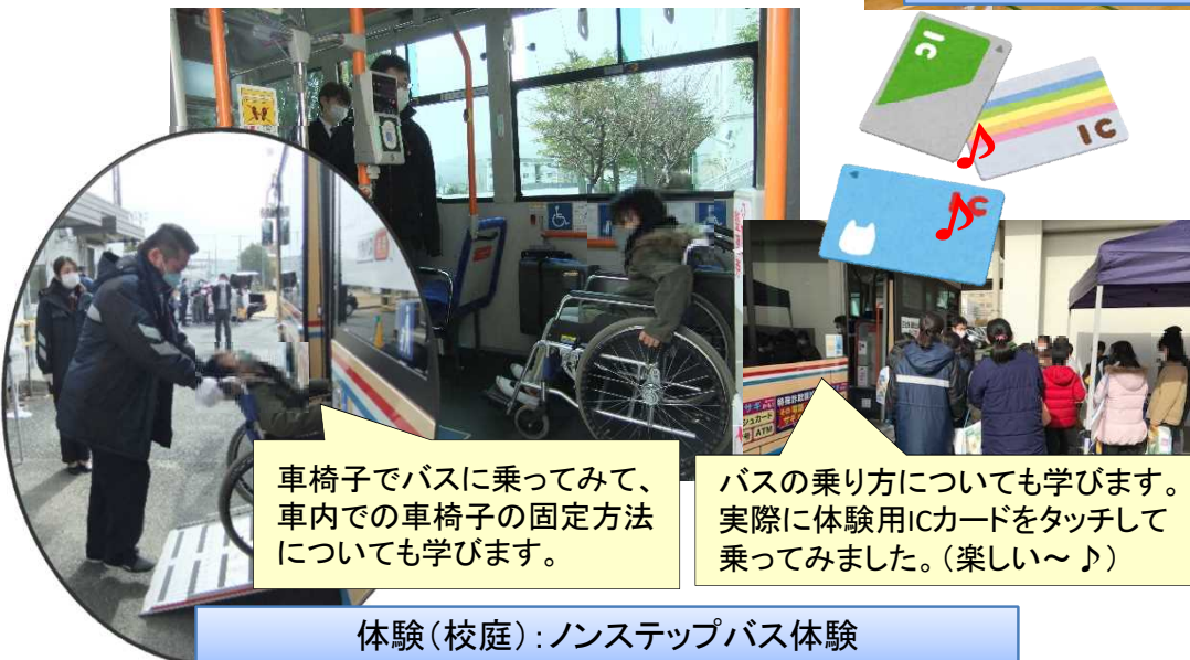
体験(校庭)：ノンステップバス体験

バスの乗り方についても学びます。実際に体験用ICカードをタッチして乗ってみました。(楽しい~♪)