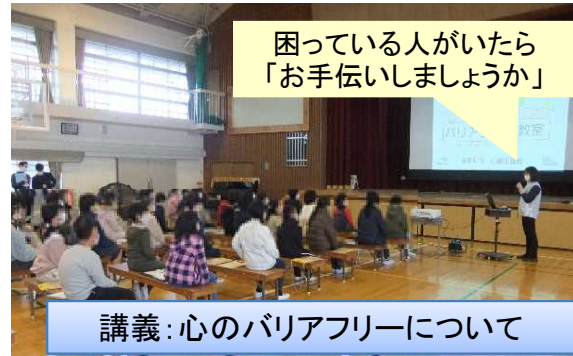
講義：心のバリアフリーについて