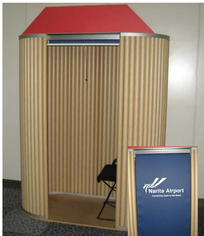
ロールカーテン を下ろせる