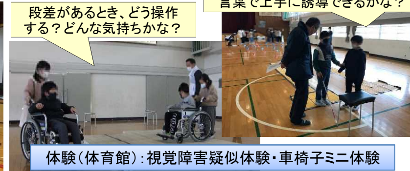
体験(体育館)：視覚障害疑似体験・車椅子ミニ体験