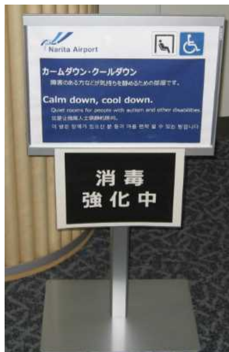
説明書き 日、英、中、韓4カ国語対応