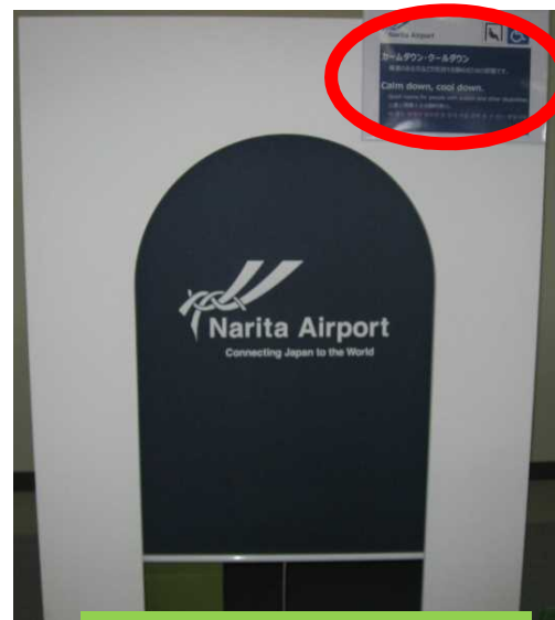
説明書き 日、英、中、韓4カ国語対応 ロールカーテン式