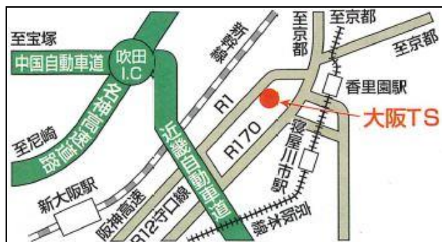
大阪トラックステーション（大阪TS）