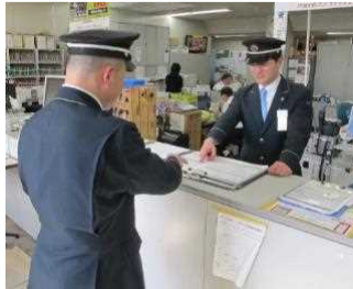
うんこうじょやくさん