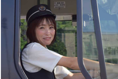
うんてんしゃさん