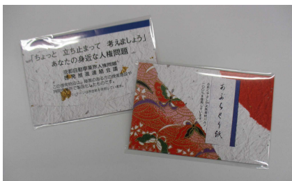
当日配布予定のあぶらとり紙