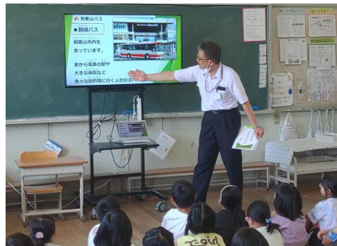
和歌山バス株式会社よりバスの種類や乗り方や降り方などを学びました