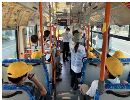
バス車内でのマナーや乗り方、降り方（停車ボタンの押し方）などを学びました。