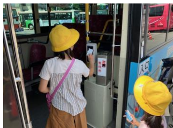
ICカードを使用した際のバスの乗降の仕方を体験しました。

和歌山バス(株)和歌山営業所において、バス車両による車いす・バリアフリー設備の紹介やバス運転席からの死角の確認、ICカードの使い方などといったバスの乗り方や降り方など、バスに触れながら学ぶなど、様々な視点からバスの魅力について学びました。