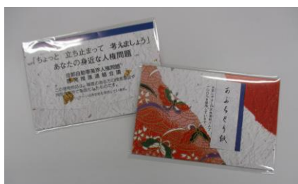
当日配布予定のあぶらとり紙