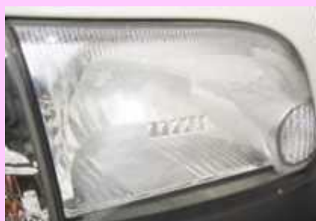
内部リフレクタの劣化