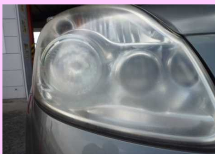
レンズ面のくもり