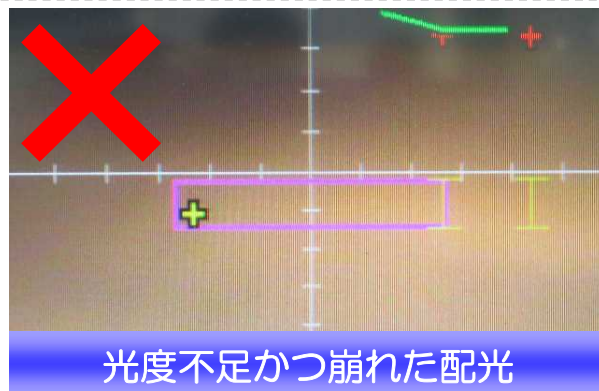
光度不足かつ崩れた配光