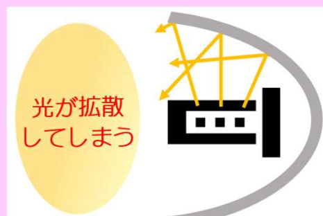
相性の悪いバルブに交換