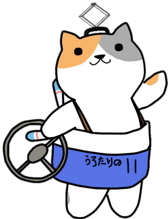
公共交通利用促進キャラクター のりたろう