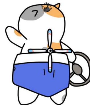
公共交通利用促進キャラクター のりたろう