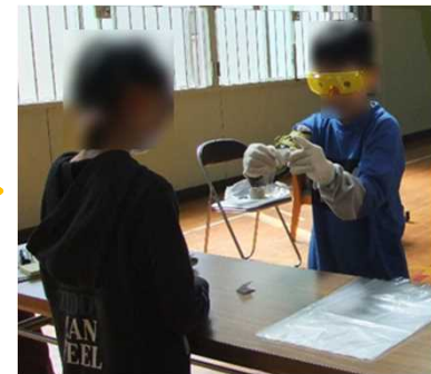
【高齢】 お買い物体験