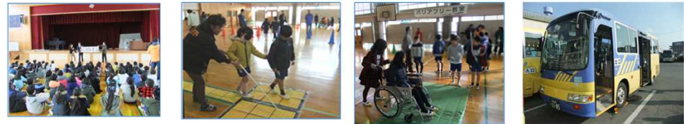
【バリアフリー教室イメージ写真】