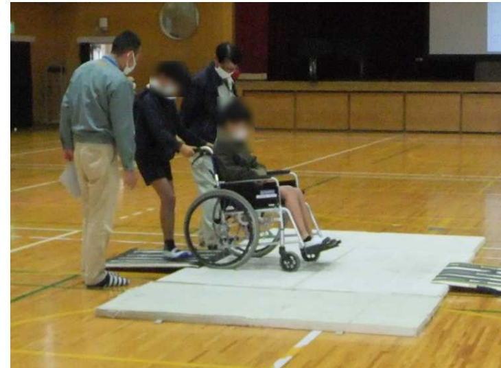
車椅子体験（段差介助体験）