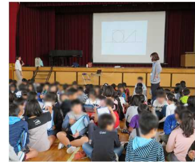
【視覚】 コミュニケーション体験