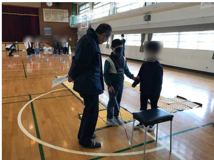
視覚障害疑似体験