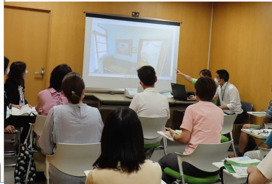
バーチャル見学会の様子

個別相談会（面接会） 場所：ハローワーク枚方面接ブース 日時：令和6年11月11日（月）14：00～16：00