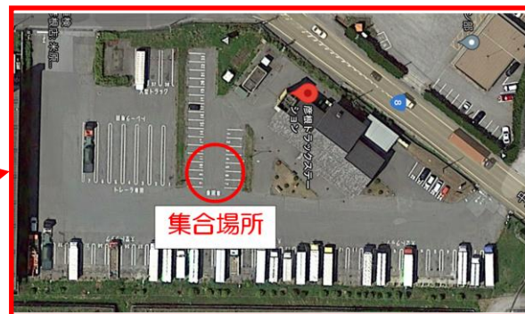
彦根トラックステーション（彦根TS）