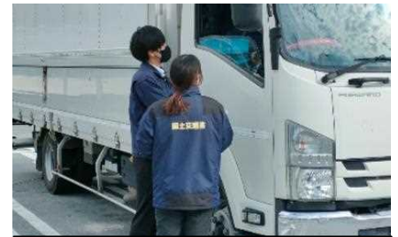
サービスエリア等でのドライバーへのヒアリング