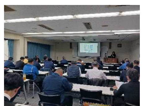
京都労働局との合同説明会