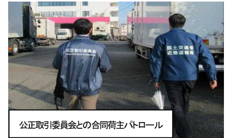
公正取引委員会との合同荷主パトロール