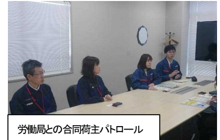
労働局との合同荷主パトロール