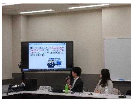
関西学院大学法学部への出前講座