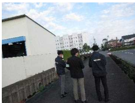
滋賀・岐阜運輸支局合同パトロール